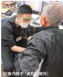
診療の様子（美和診療所）