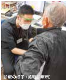
診療の様子（美和診療所）